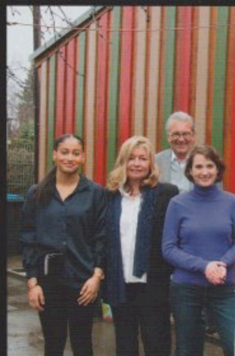
Der Vorstand von Aachen Sozial freut sich mit den beiden Preisträgerinnen

Der Plastikmüll in unseren Ozeanen ist eines der größten Umweltprobleme unserer Zeit. Meeresforscher schätzen, dass jedes Jahr bis zu 13 Millionen Tonnen Plastikmüll in den Ozeanen und Meeren der